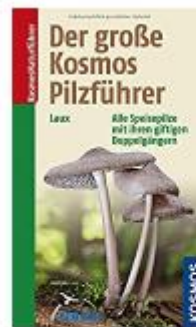
Der große Kosmos Pilzfürer: Alle Speisepilze mit ihren giftigen... › Hans E. Laux