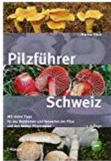
Pilzfürer Schweiz: Mit vielen Tipps fürs Bestimmen und Verwerten und den besten Pilzrezepten 14. Mai 2018 von Markus Flück