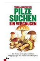
Pilze suchen - ein Vergnügen: Die besten Speisepilze und ihre Doppelgänger. Mit vielen neuen Rezepten ( 4. Juni... 1608