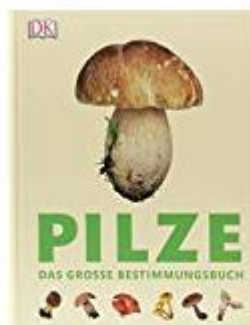
Pilze: Das große Bestimmungsbuch Thomas Læssøe