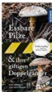
Essbare Pilze und ihre giftigen Doppelgänger: Pilze sammeln - aber richtig