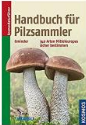
Handbuch für Pilzsammler: 340 Arten Mitteleuropas sicher bestimmen Extra:...